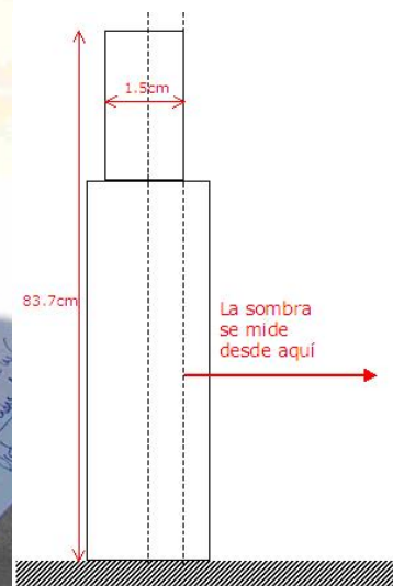
Imagen 6 (F. López)